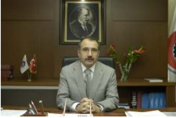
Ömer DİNÇER Çalışma ve Sosyal Güvenlik Bakanı