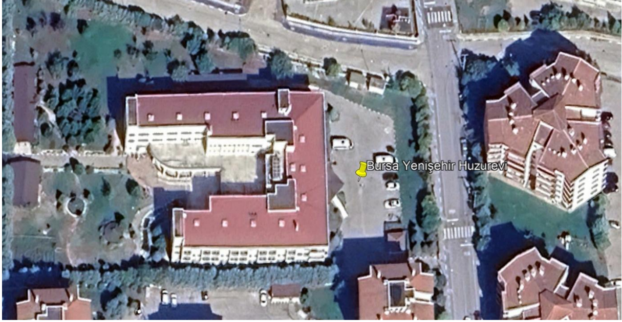
Şekil 1. Proje Alanı Uydu Görüntüsü