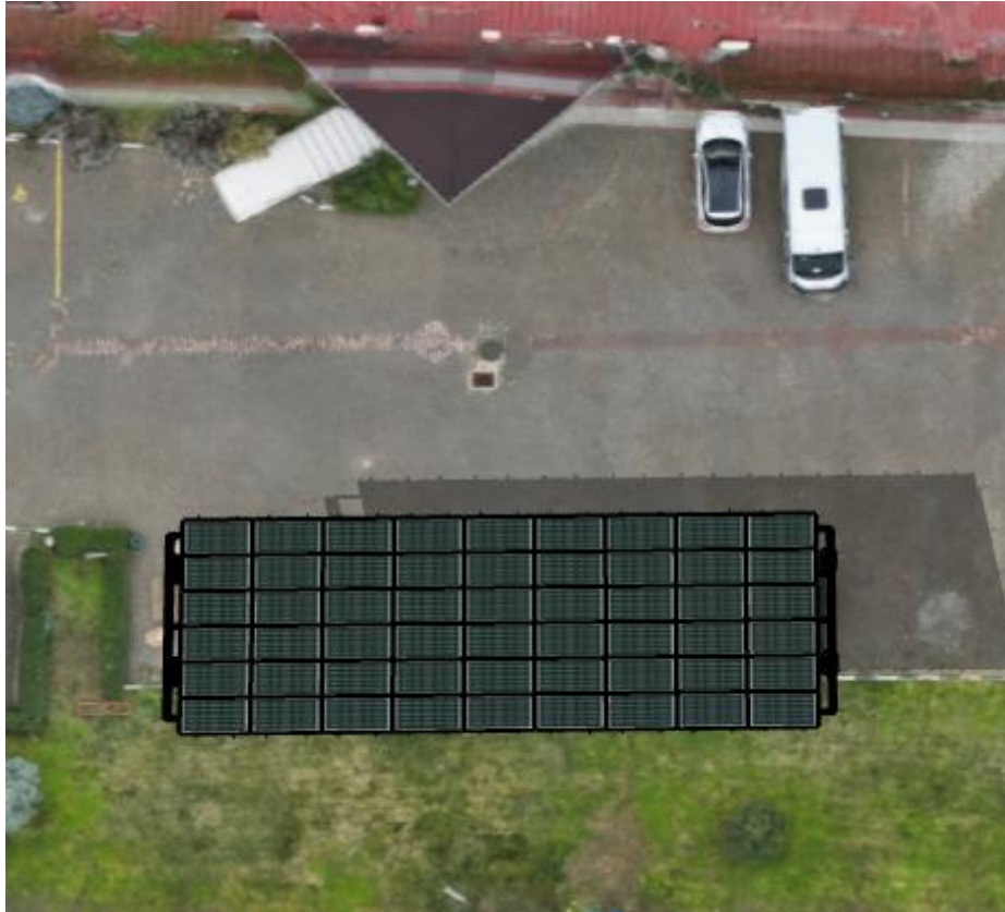
Şekil 2. Alt Proje Yerleşim Alanı