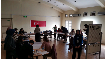
Istanbul-Türkiye, 28 Şubat 2024

Yerel Atölye Çalışmaları: Gençlerin hikikomori konusunda farkındalıklarını artırmak amacıyla, proje ortaklarımızla birlikte çeşitli local workshoplar düzenledik. Projenin gençlerle buluşmasını sağlayan bu workshoplar, gençlerin aktif katılımını teşvik eden ve onların kendi deneyimlerini paylaşmalarına olanak tanıyan bir formatta gerçekleştirildi. Workshoplar sırasında şu etkinlikler yer aldı: