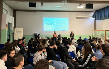
Reggio Emilia-İtalya, 7 Şubat 2024