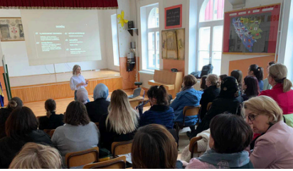
Saraybosna-Bosna Hersek, 11 Mart 2024